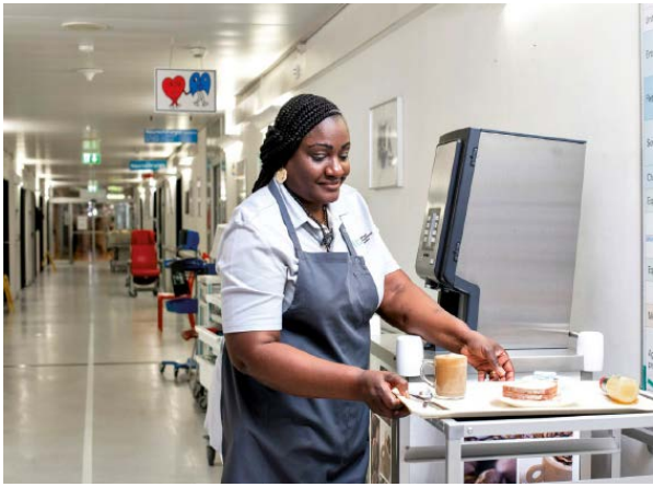
Aux HUG, près de 1600 repas sont préparés et livrés en chambre, trois fois par jour, par des agents hôteliers. (GENÈVE, 20 FÉVRIER 2023/JULIEN GREGORIO/HUG)